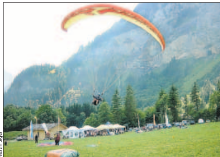
Mit Zielflugwettbewerben feierte der Gleitschirmclub Kandersteg die Eröffnung ihres neuen Betriebsgebäudes (links).