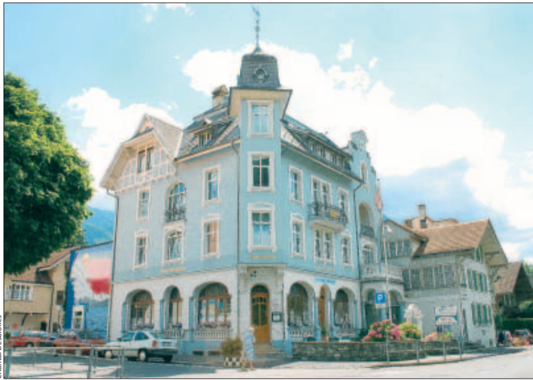
Engagement für ein gesundes Klima: Das Interlaken Hotel Lötschberg ist einer der 18 Betriebe, welcher mit dem Label für freiwilligen Klimaschutz der Energie-Agentur der Wirtschaft ausgezeichnet wird.

Mit ihrem offiziellen Label zeichnet die EnAW nun diejenigen 18 Betriebe der Gruppe aus, die den jährlichen Energieverbrauch und den CO 2 -Ausstoss bereits deutlich verringern konnten. Die vorliegenden Einsparungen resultieren primär aus der Optimierung technischer Anlagen und organisatorischen Verbesserungen. Zum Erfolg beigetragen haben aber auch neue, wirtschaftlichere Geräte und das Ersetzen