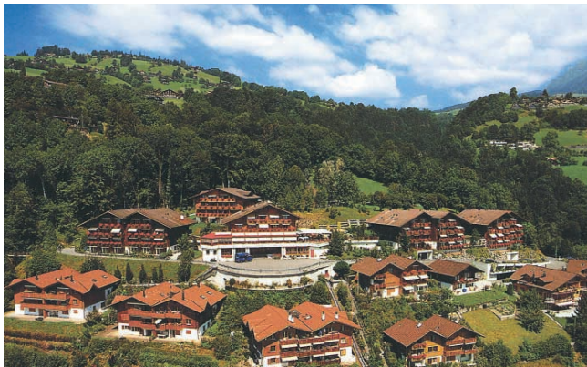
Auf Logenplatz am Thunersee: Zentrum Schönberg in Gunten.

Mit direkter Aussicht auf die schönsten Gipfel der Schweizer Alpen verfügt das Rehabilitations- und Gesundheitszentrum Schönberg in Gunten über eine einzigartige Attraktion. Doch auch hinter den Kulissen läuft alles optimal – dank der intelligenten Kassenlösung von Selecta speziell im Gastrobereich.